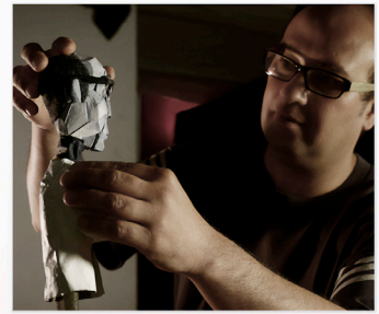
Tournage de No-Go Zone Sélectionné et primé dans plusieurs festivals Diffusion "Court-circuits" et 1000 jours sur Arte.tv